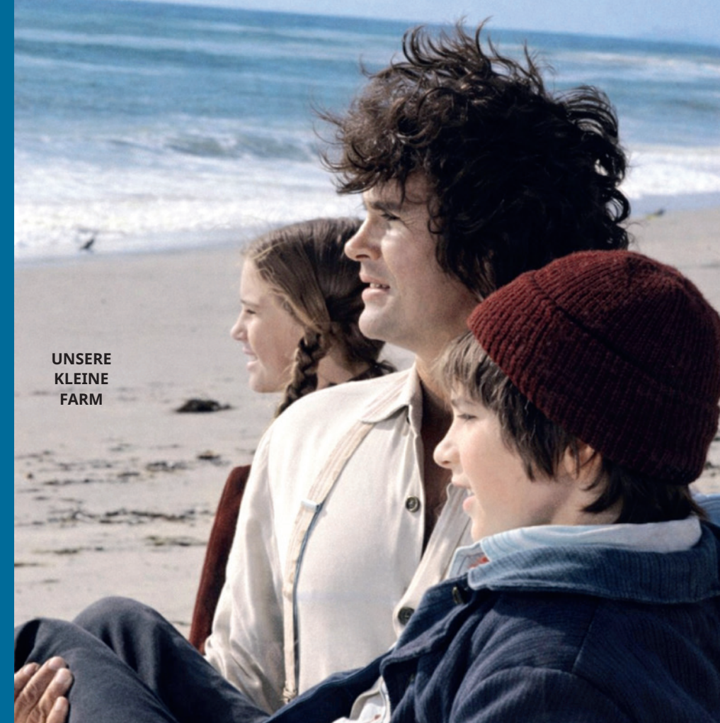
UNSERE KLEINE FARM

„Dass Liebhaber in Film und Fernsehen gutaussehende, weiße Männer sind, ist bloß eine altmodische Hollywood-Idee“, sagt Dinklage. Seine Kritik richtet sich auch gegen Disneys SCHNEEWITTCHEN -Realverfilmung aus dem Jahr 2025, die er als „verdammte rückständig“ bezeichnete. Trotz der progressiven Besetzung der Hauptrolle mit einer Latina bemängelte er die Darstellung der sieben Zwerge als stereoty-