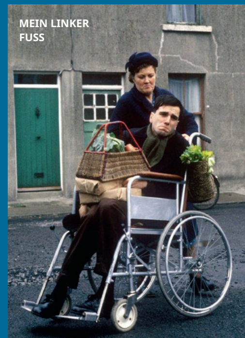
MEIN LINKER FUSS