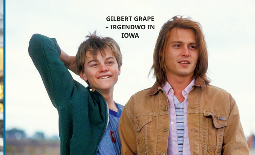
GILBERT GRAPE – IRGENDWO IN IOWA