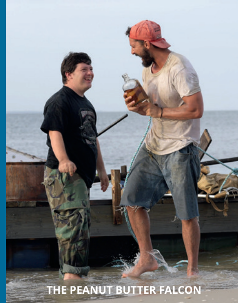
THE PEANUT BUTTER FALCON

Ein echtes Ausrufezeichen in der Diskussion um Besetzung und Darstellung von Rollen mit Behinderungen setzte THE WALKING DEAD mit der Figur Connie. Gespielt wird sie von Lauren Ridloff, die selbst gehörlos ist. Connie ist die erste gehörlose Figur im gesamten Franchise – und eine der ersten gehörlosen Hauptfiguren in einer Mainstream-Horrorserie. Ihre Gehörlosigkeit stellt sie in einer Welt voller Zombie-Geräusche vor massive Herausforderungen. Sie kann das Knacken von Ästen oder das Stöhnen der Untoten nicht hören. Doch die Serie dreht die Perspektive: In einigen Szenen wird völlige Stille inszeniert – das Publikum erlebt die Bedrohung aus Connies Sicht. Ihre außergewöhnliche visuelle Wahrnehmung,