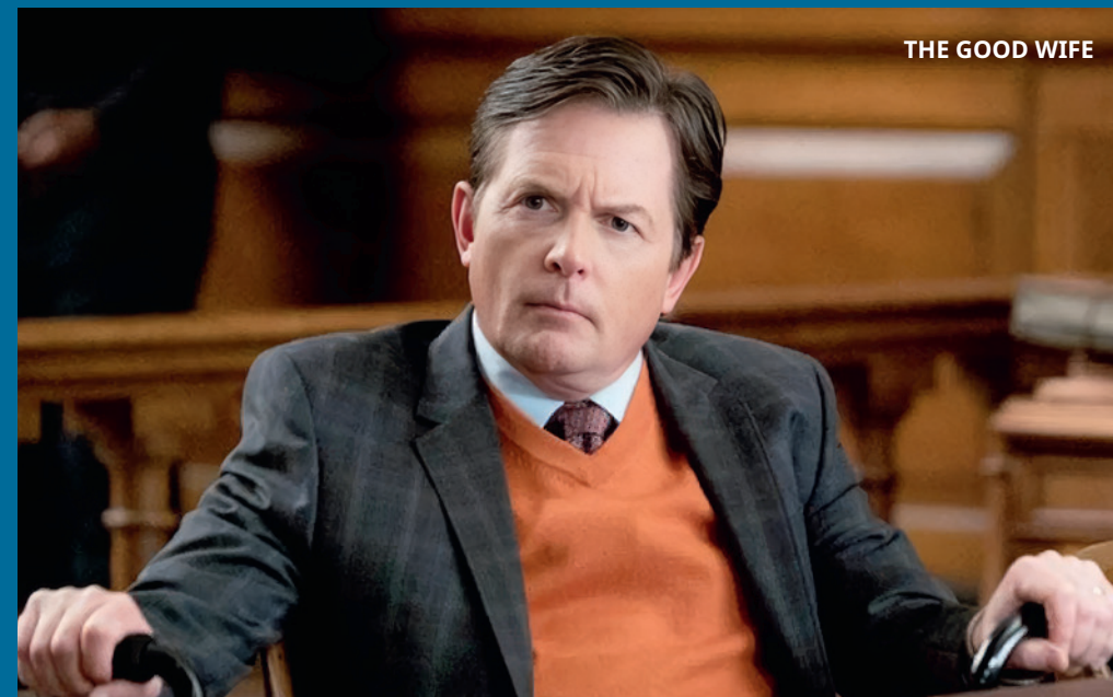
THE GOOD WIFE