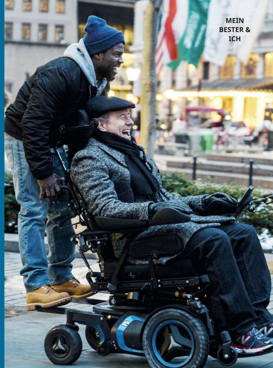
MEIN BESTER & ICH

Eine Ausnahme bildete die US-Serie ALLES OKAY, CORKY? (1989–1993), die mit Chris Burke als „Corky Thatcher“ eine Hauptfigur und einen Darsteller mit Down-Syndrom ins Zentrum