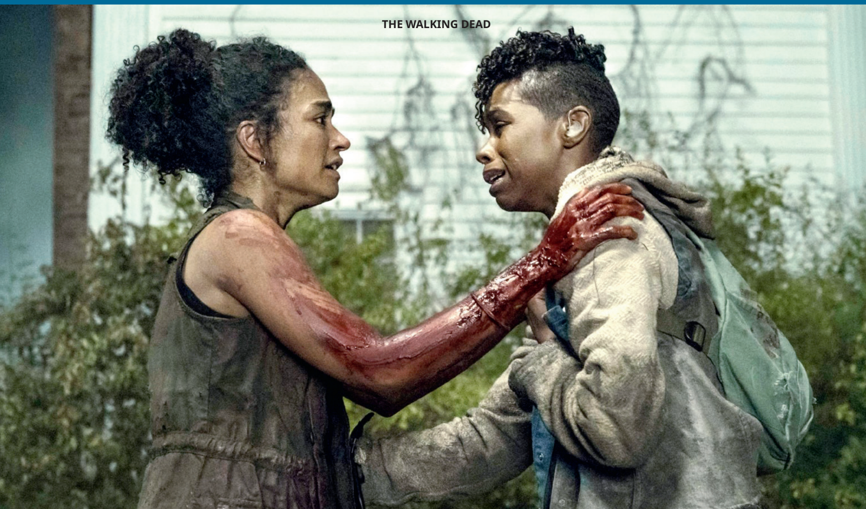
THE WALKING DEAD

Darstellung prägt unser Bild von Realität. Wenn Behinderung im Film nur als Tragödie existiert, verengt das den gesellschaftlichen Blick. Authentische Repräsentation dagegen normalisiert Vielfalt – gerade im Mainstream. Hollywood steht an einem Wendepunkt. Zwischen Blockbuster-Logik, Award-Politik und echtem Bewusstseinswandel. Für Fans von Sci-Fi, Horror und Drama bedeutet das: neue Perspektiven, neue Heldinnen und Helden, neue Geschichten. Inklusion ist kein Genre. Sie ist eine Frage der Haltung. Und vielleicht beginnt sie genau dort, wo eine Behinderung nicht mehr die Hauptrolle spielt – sondern einfach Teil der Geschichte ist. dlm