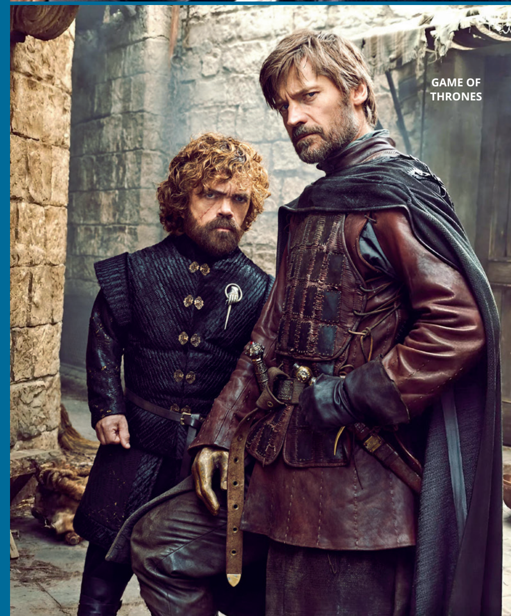
GAME OF THRONES